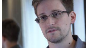
Edward Snowden