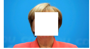
N-TV.DE Angela Merkel räumt Fehler ein