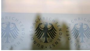
ARCOR.DE Bundestag beschließt Geheimdienstreformen